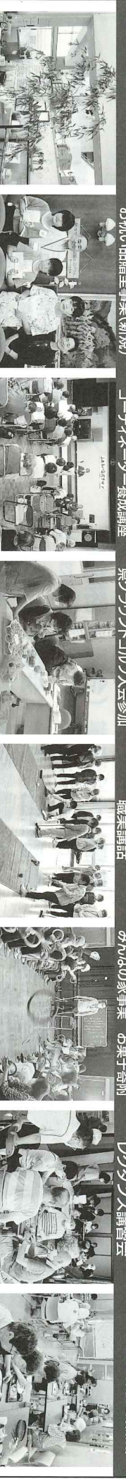
不二聖心女子学院 七夕飾り 贈呈