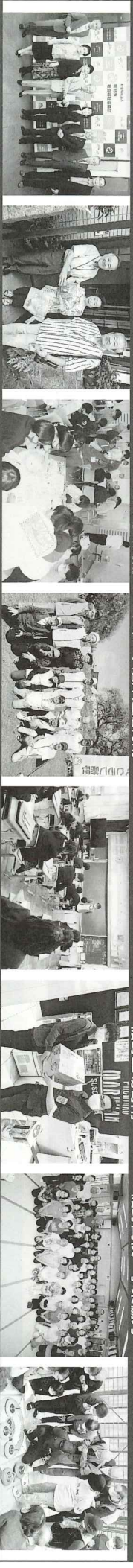
シニアクワテラ連合会 寄附