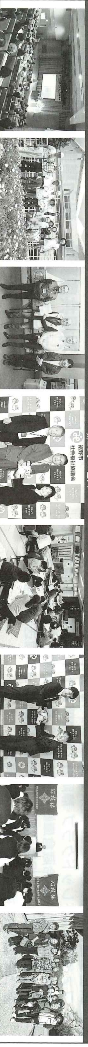
県ボランティア研究集会