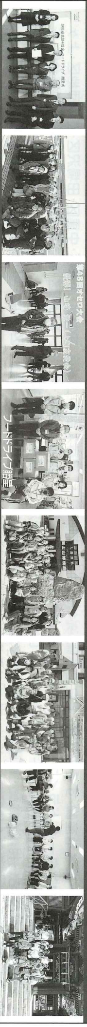
東部4信金フーボドリアン贈呈