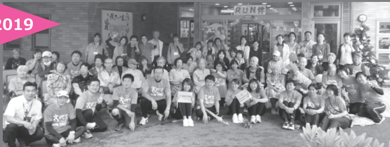
RUN伴(ランとも)は、今まで認知症の人と接点がなかった地域住民と、認知症の人や家族、医療福祉関係者が一緒にタスキをつなぎ、日本全国を縦断するイベントです。写真は昨年のゴールの様子(やざきケアセンター紙ふうせん)

協力機関:あいの郷・ヤザキケアセンター紙ふうせん・ヘルメディカルケア・裾野市介護保険課・裾野市地域包括支援センター・裾野市北部地域包括支援センター・裾野市居宅介護支援事業所・裾野市介護家族の会・裾野市社会福祉協議会