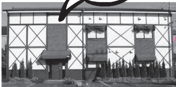
(1)・(2)の2事業を実施している 障がい者支援プラザ(深良) 2事業の他、障がい児者相談支援事業所「サポートセンターしゃきょう」(市受託事業)も入り、3事業を一体的に運営